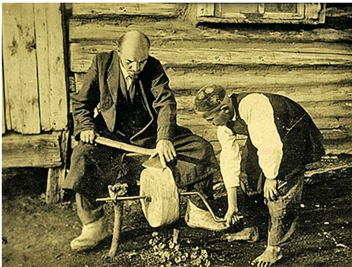
1905 г. Владимир Ильич готовит народные массы к восстанию. Он самодельно точит оружие, постоянно агитирует среди рабочих и передовых слоев крестьянства.